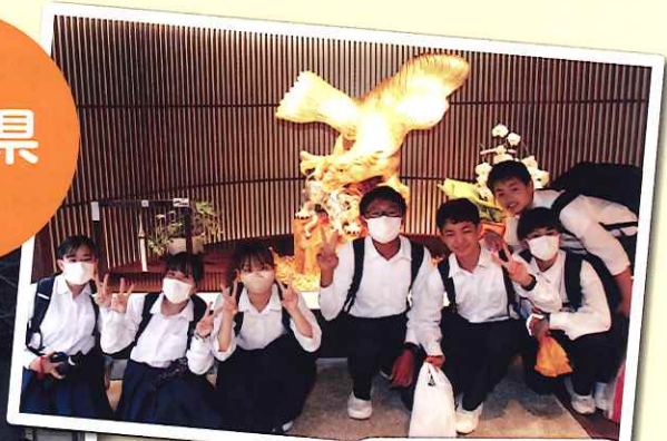
金沢市内 班別行動