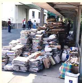
たくさんの資源が集まりました。分別されて回収車を待ちます。