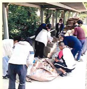
スチール缶が混じっていることも。しっかり分別します。