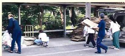
運び込まれた古新聞などを車から降ろします。

新聞・段ボール・アルミ缶など、学区内の回収場所に集められた資源を、環境委員が車で学校に運び込みます。校門横の駐輪場では、委員、役員、先生方が手際よく作業していました。