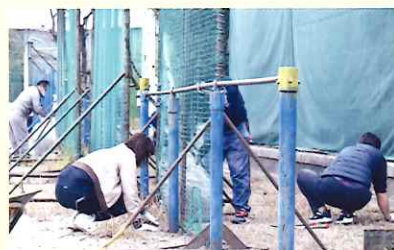
校庭の草取りの様子

広い校内ですが、大勢の委員の方々のご協力により、普段行き届かないところもスッキリきれいになりました。マスクを付けての作業、大変お疲れ様でした！