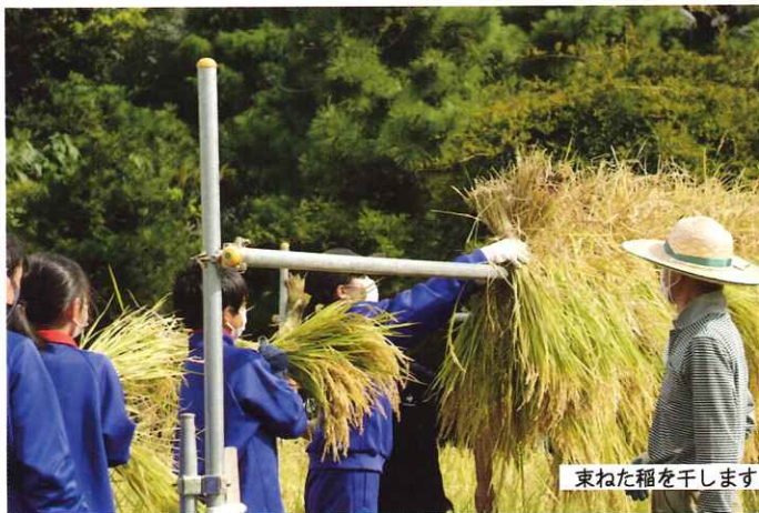
束ねた稲を干します