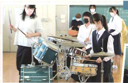
ドラムって難しい～