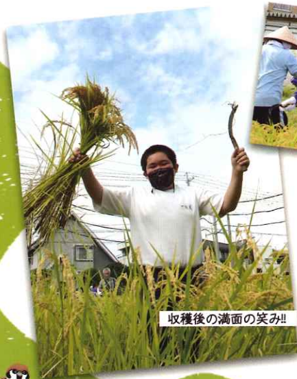
収穫後の満面の笑み!!