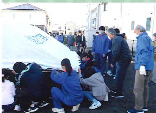
地域の方と協力してテントの組立