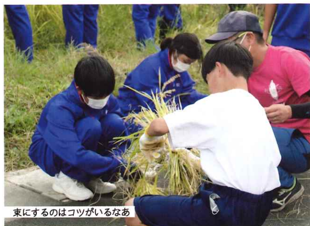
束にするのはコツがいるなあ