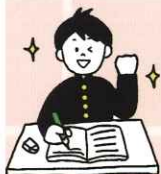
先生教えてください!!