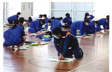
9分間の胸骨圧迫訓練