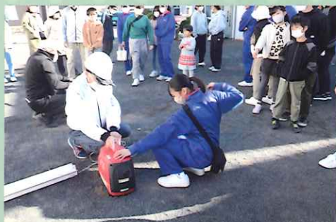
発電機の始動体験

コロナ禍で人と人との繋がりが減ってきてしまっていますが、今年度は学校公開、校内バレーボール大会、地区大会、高中バザー、地域防災訓練など、様々な行事が行われ「地域と学校」「先生と保護者」それぞれの交流を行うことができました。来年度もこのような交流の場が多く設けられることを願います。