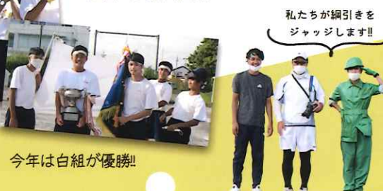
今年は白組が優勝!!

今回の体育祭で、僕達第73代では、「燃やせ高松魂～全色統一さ出陣～」というスローガンを掲げ行きました。例年とは異なる1日開催となり、感染症対策の徹底がより重視されました。そんな中でも、学級委員を中心とした呼びかけや、専門委員会での感染症対策に基づいたルール作りなどのお陰で、明るい笑顔を見ることができました。全校で誰もが楽しめる体育祭になり、とても楽しかったです。