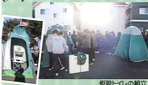
仮設トイレの組立