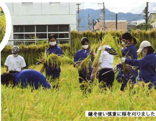
鎌を使い慎重に稲を刈りました