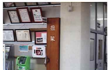
高松中のAEDは玄関ホールにあります。もしもの時は活用しましょう。