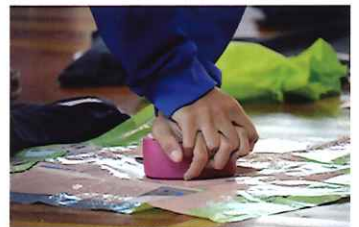
両手をしっかり重ね、力強く圧迫します