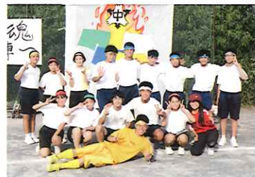
仲良し生徒会役員