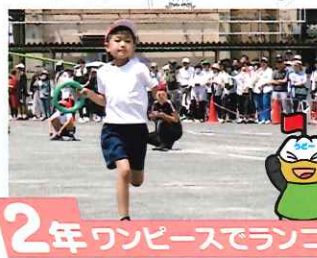
2年 ワンピースでランニング