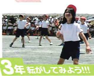
3年 転がしてみよう!!!