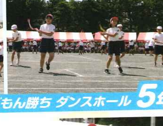
楽しんだもん勝ち ダンスホール 5年