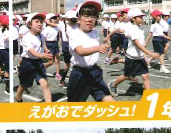
えがおでダッシュ! 1年