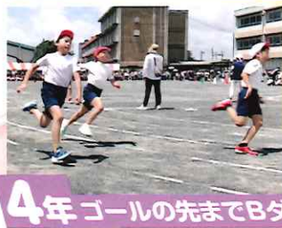
4年 ゴールの先までBダッシュ!