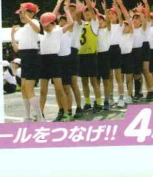
地上で 空で ボールをつなげ!! 4年