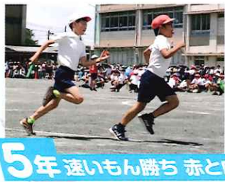
5年 速いもん勝ち 赤と白