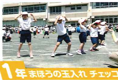
1年 まほうの玉入れ チェッコリ2023