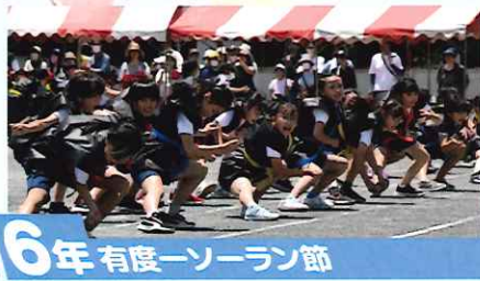
6年 有度一ソーラン節