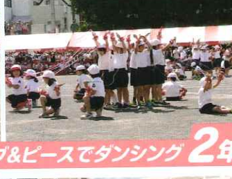
ラブ&ピースでダンシング 2年